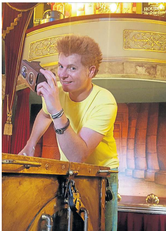
► Magos nacionales e internacionales ofrecerán espectáculos en directo llenos de sorpresas, las próximas semanas.

EL COMPLEMENTO PERFECTO // Este revolucionario método de foto recuerdo se complementa con el desarrollo de unas gafas de realidad virtual diseñadas especialmente para Magic Museum by Yunke, con dos acabados diferentes y precios al alcance de todos los bolsillos. Así, los visitantes