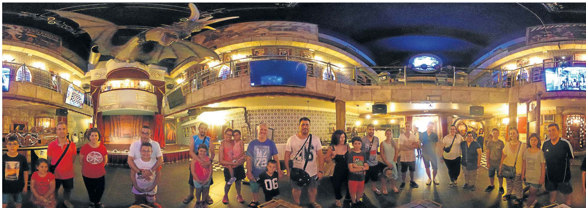
► Los turistas de Peñíscola cumplen con su cita en el Magic Museum by Yunke y hacen fotografías esféricas, con la cámara de 360°, que pueden adquirir como recuerdo de su experiencia.

EL MAGIC MUSEUM BY YUNKE DE PEÑÍSCOLA INCORPORA UN SISTEMA ÚNICO DE FOTOS RECUERDO